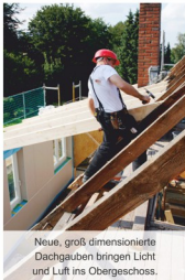
Neue, groß dimensionierte Dachgauben bringen Licht und Luft ins Obergeschoss.

Ich freue mich, Sie im Rahmen der diesjährigen Gewerbeausstellung in Laubach, am 18. und 19. März 2017 , auf dem Stand von team@work begrüßen zu dürfen. Oder vereinbaren Sie doch einfach einen individuellen Termin unter 06405 / 95 06 75 , sowie per E-Mail: holzbau-schmidt-laubach@t-online.de