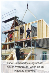
Eine Dachaufstockung schafft neuen Wohnraum, wenn es im Haus zu eng wird.

Weitere Infos auch unter www.holzbau-schmidt-laubach.de